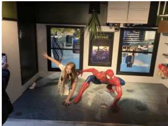
Other pictures 7