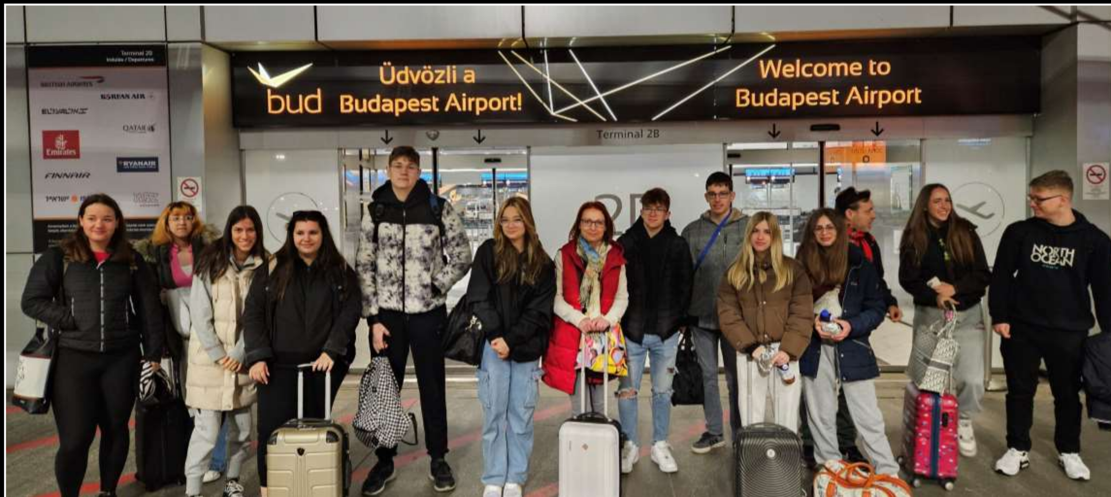
ISZTI London nyelvi túra 2023