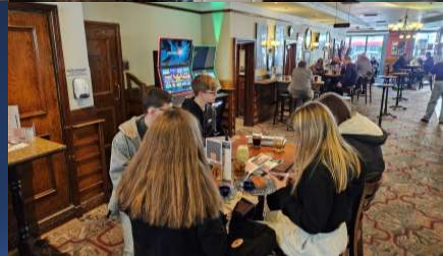
Breakfast near the Victoria station