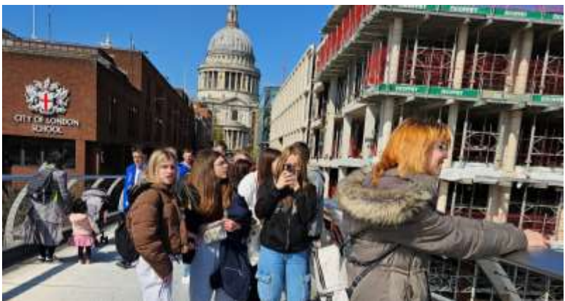
St Paul's Cathedral, Millenium Bridge