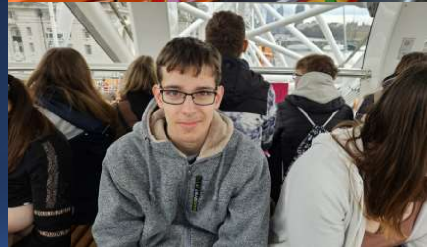
Other pictures 3